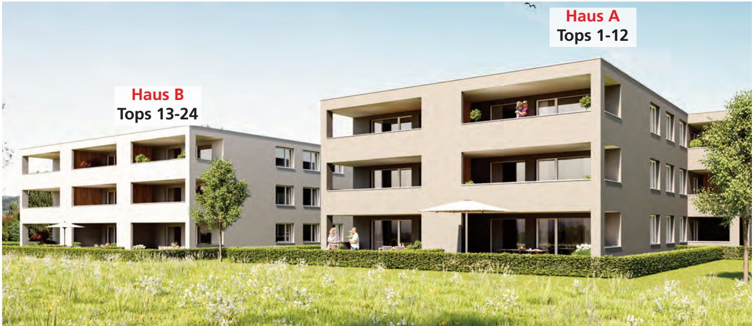
Haus A Tops 1-12