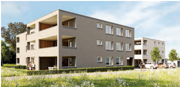
Haus B Tops 13-24