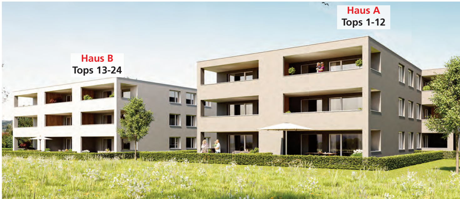
Haus A Tops 1-12